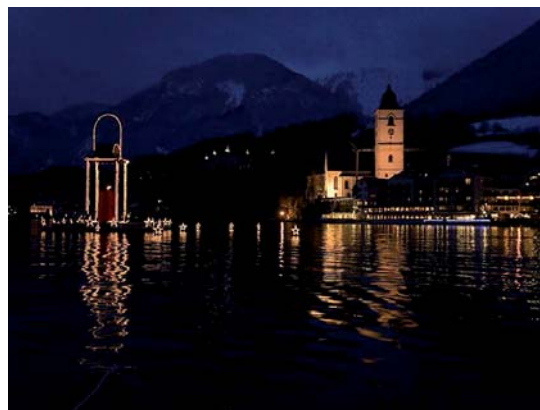
Foto rechts St. Wolfgang am Wolfgangsee

Die SPÖ Ebenthal bringt das Friedenslicht von Betlehem wieder nach Ebenthal in unsere Gemeindestube. Sie können sich das Licht gerne im Gemeindeamt (Vorraum) am 24.12.2009 in der Zeit von 9.00 bis 12.00 Uhr abholen.