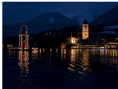
Foto rechts St. Wolfgang am Wolfgangsee

Die SPÖ Ebenthal bringt das Friedenslicht von Betlehem wieder nach Ebenthal in unsere Gemeindestube. Sie können sich das Licht gerne im Gemeindeamt (Vorraum) am 24.12.2012 in der Zeit von 9.00 bis 12.00 Uhr abholen.