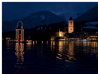
Foto rechts St. Wolfgang am Wolfgangsee

Die SPÖ Ebenthal bringt das Friedenslicht von Betlehem wieder nach Ebenthal in unsere Gemeindestube. Sie können sich das Licht gerne im Gemeindeamt (Vorraum) am 24.12.2013 in der Zeit von 9.00 bis 12.00 Uhr abholen.