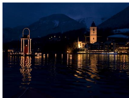
Foto rechts St. Wolfgang am Wolfgangsee

Die SPÖ Ebenthal bringt das Friedenslicht von Betlehem wieder nach Ebenthal in unsere Gemeindestube. Sie können sich das Licht gerne im Gemeindeamt (Vorraum) am 24.12.2013 in der Zeit von 9.00 bis 12.00 Uhr abholen.